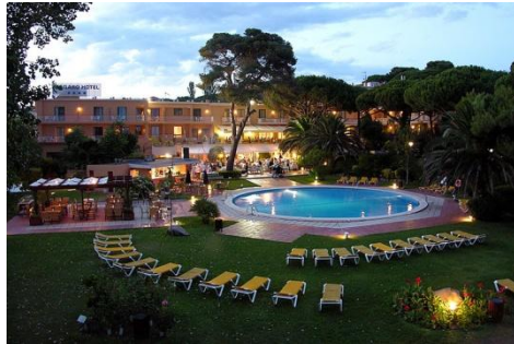
Jardins de l'Hotel

Un hotel de 4 estrelles, per a un curs excel·lent!