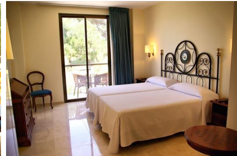
Habitacions amb televisió, música i bany complet