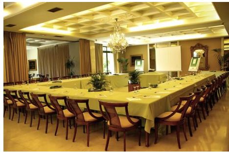
Sala de treball